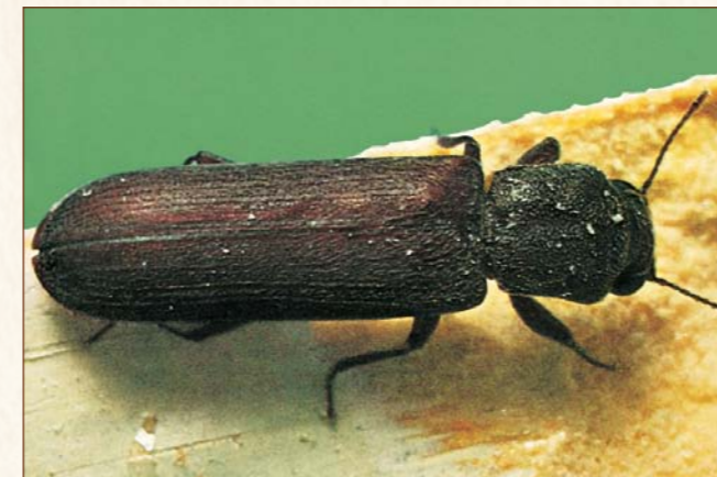
Brauner Splintholzkäfer Lyctus brunneus

Larve: bis zu 6 mm, cremefarben und fein behaart, engerlingsartig gekrümmt, mit drei gut ausgebildeten Beinpaaren, Kopf gelblich-braun, Mandibeln dunkelbraun. Befällt Nadel- und Laubhölzer. Ein Befall ist durch die kreisförmigen 1 – 3 mm großen Fluglöcher erkennbar. Die Entwicklung bis zum Käfer kann bis zu 10 Jahre dauern.