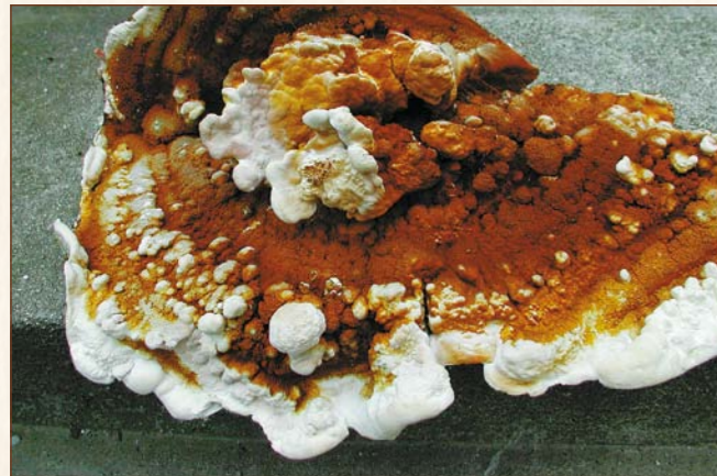
Echter Hausschwamm auch Mauerschwamm, Serpula lacrymans

Befallen bevorzugt Nadelhölzer, selten Laubhölzer, und treten meist bei Holz im Freien auf (Zäune, Balkone, Fenster). Das Mycel ist im allgemeinen nicht sichtbar in Holzinneren und verursacht Innenfäule. Die Fruchtkörper entstehen meist an den Hirnholzflächen oder an Trockenrissen als langgestreckte Leisten oder muschelförmige Konsolen. Trockenresistent können sie über Jahre unbemerkt bleiben. Häufig auch Schäden an Dachkonstruktionen.