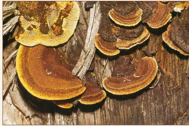
Blättlinge Gloeophyllum spez.

Befallen bevorzugt Nadelhölzer, selten Laubhölzer, und treten meist bei Holz im Freien auf (Zäune, Balkone, Fenster). Das Mycel ist im allgemeinen nicht sichtbar in Holzinneren und verursacht Innenfäule. Die Fruchtkörper entstehen meist an den Hirnholzflächen oder an Trockenrissen als langgestreckte Leisten oder muschelförmige Konsolen. Trockenresistent können sie über Jahre unbemerkt bleiben. Häufig auch Schäden an Dachkonstruktionen.