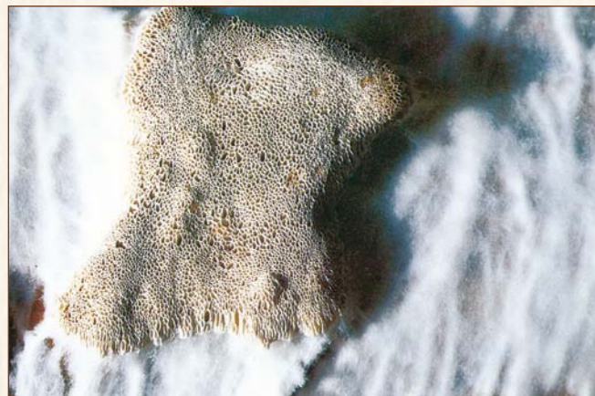
Porenschwamm Poria spez.

Gefährlichster holzerstörender Pilz. Befällt besonders Nadelhölzer, aber auch Laubhölzer. Er transportiert Wasser durch bis zu bleistiftdicke Mycelstränge über viele Meter und sogar durch Mörtelfugen hindurch, befeuchtet damit auch trockenes Holz und zerstört es. Erkennbar an watteartigem weißen Luftmycel, grauem Oberflächenmycel und an rotbraun gefärbten fladenartigen Fruchtkörpern. Kann großflächig im Verborgenen auftreten und überwächst Gegenstände, die nicht angegriffen werden. Bildet Sporen in großen Mengen, die als rotbrauner Staub auftreten. Darf nicht unterschätzt werden.