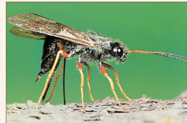
Holzwespe Sirex juvencus

Larve: engerlingsähnlich wie beim gewöhnlichen Nagekäfer, jedoch mit deutlich erkennbarem Atemloch am letzten Hinterleibssegment. Befällt stärkereiches Splintholz von Import- u. einheimischen Laubhölzern. Befällt auch trockenes Holz im Innenbereich mit Feuchtigkeiten unter 10 %. Ein Befall ist durch die kreisrunden etwa 1 – 1,5 mm großen Fluglöcher erkennbar. Die Entwicklung bis zum Käfer dauert zwischen 3 Monaten u. 2 Jahren.