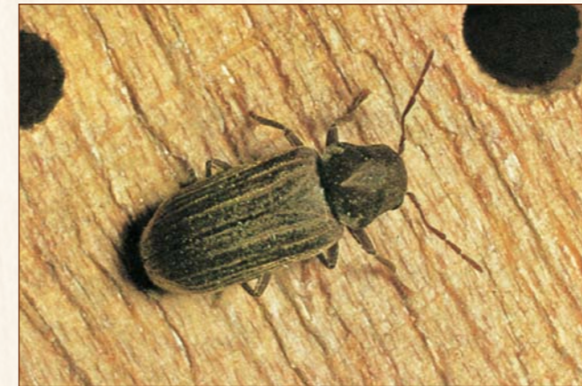
Gewöhnlicher Nagekäfer Anobium punctatum

Larve: 15 – 30 mm, elfenbeinfarben, deutlich segmentiert, Mandibeln (Beißwerkzeuge) rotbraun. Befällt nur Nadelhölzer und bevorzugt den Splintbereich. Lässt eine dünne Holzschicht stehen. Ein Befall wird meist erst durch die ovalen etwa 4 x 7 mm großen Fluglöcher entdeckt. Die Entwicklung bis zum Käfer dauert durchschnittlich 3 bis 7 Jahre