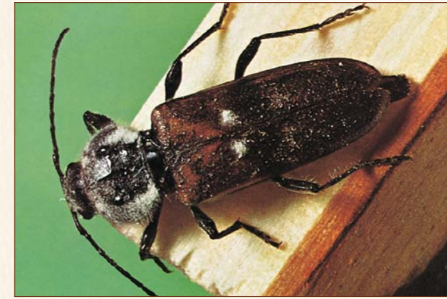
Hausbock Hylotrupes bajulus

Käfer: 8 – 20 mm, Körper und Flügeldecken schwarz bis schwarzbraun, dicht behaarter Halsschild, gelblich-weiße Flecken auf den Flügeldecken.