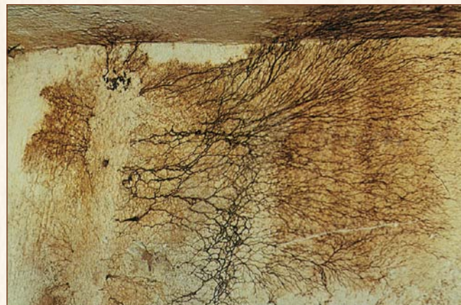
Brauner Kellerschwamm auch Warzenschwamm, Coniophora puteana

Befällt bevorzugt Nadelhölzer, selten Laubhölzer, mit hohem Wassergehalt bei Temperaturen zwischen 3 °C und 36 °C. Bildet ein weißes, reich verzweigtes Mycel an der Oberfläche (wie Eisblumen). Die Fruchtkörper erscheinen als weiße, cremefarbig bis rosa gefärbte dreidimensionale Gebilde mit deutlich erkennbaren Poren. Vorkommen an Decken und Dachkonstruktionen.